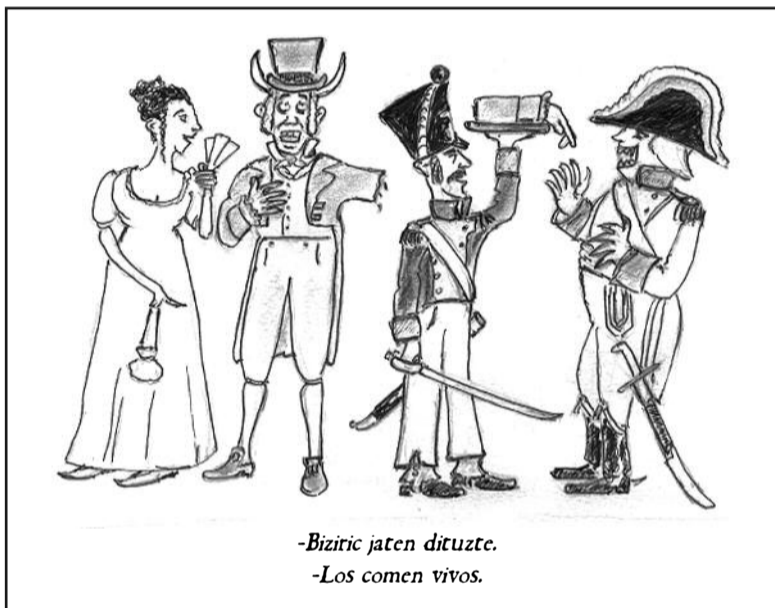
-Bizitric jaten dituzte. -Los comen vivos.

Ved, pues, Tolosarras, qué ridículo es el comienzo del ocaso de tan grandes personajes del que, de seguro, os seguirá hablando esta Bayoneta.