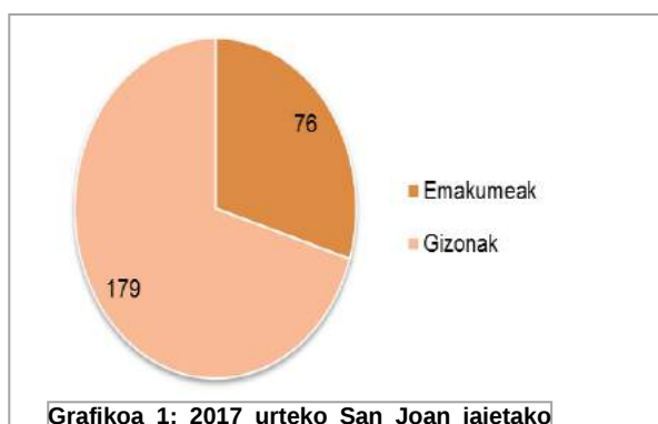
Grafikoa 1: 2017 urteko San Joan jaietako musika ikuskizunetan emakume eta gizonen kopuruak

Musikarien kopuru totala sexuen arabera berezituta 2017 urteko San Joanetako jaietan musika arloan aritutako guztien %70,19a gizonezkoak izan dira eta %29,8a emakumezkoak. Agerian gelditzen da, beraz, talde mistoak igo arren, emakumeen presentzia motelago handitzen ari dela.