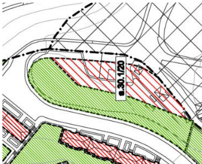
HAPOk ordenazio xehatuaren planoak

e.10 bide komunikazio-sareari dagokionez, HAPOn 370 m 2 inguruko lagapena aurreikusten da (5 m inguruko zabalera duen espaloia). Plan Berezian, berriz, 118 m 2 -ko lagapena proposatzen da. Hori zuzendu egin beharko da, gutxienez 2,50 m-ko zabalera duen lagapena egin beharko da indarrean dagoen irisgarritasun araudia betetzen duen espaloia eraiki ahal izateko.