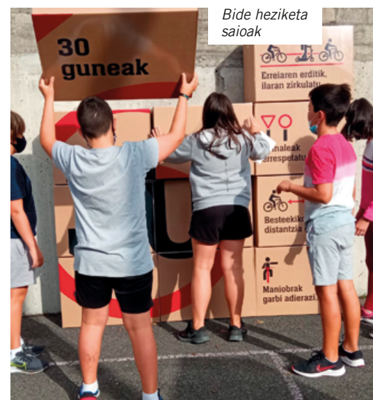
Bide heziketa saioak

Dentro de las actividades realizadas dentro de la Semana de la Movilidad se han celebrado una feria de segunda mano de bicis y patinetes, sesiones sobre seguridad vial en los centros escolares de Tolosa y la actividad “En bici no hay edad” junto con las y los participantes de Mugi Tolosa.