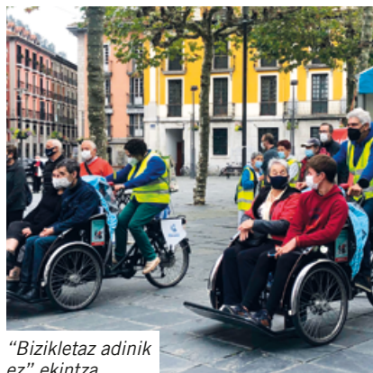
“Bizikletaz adinik ez” ekintza

Asteklimaren baitan, heziketa saioak, hitzaldiak eta ibilbide gidatuak ere antolatu ditu Udalak irailean, aldaketa klimatikoaren erronka globalari tokikotasunetik erantzuteko urratsak ematen jarraitzeko.