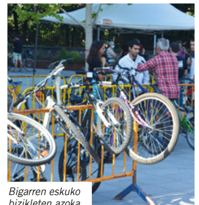
Bigarren eskuko bizikleten azoka

Dentro de las actividades realizadas dentro de la Semana de la Movilidad se han celebrado una feria de segunda mano de bicis y patinetes, sesiones sobre seguridad vial en los centros escolares de Tolosa y la actividad “En bici no hay edad” junto con las y los participantes de Mugi Tolosa.