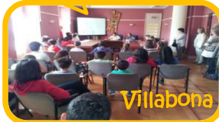
BUŞaren ordutegi, ibilbide, markesina eta geldiuneak hobetu