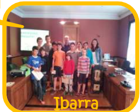
Ongi etorri EA21eko proiektura Fraisoroko lagun berriak!!!